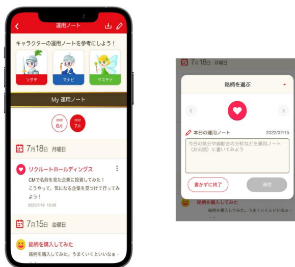
<STOCKPOINT for MUFG 運用ノート イメージ>